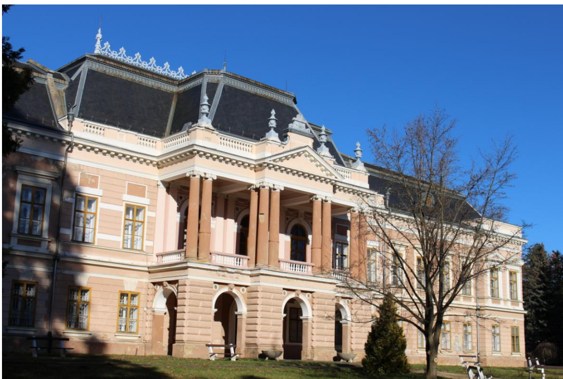
A lengyeli kastély