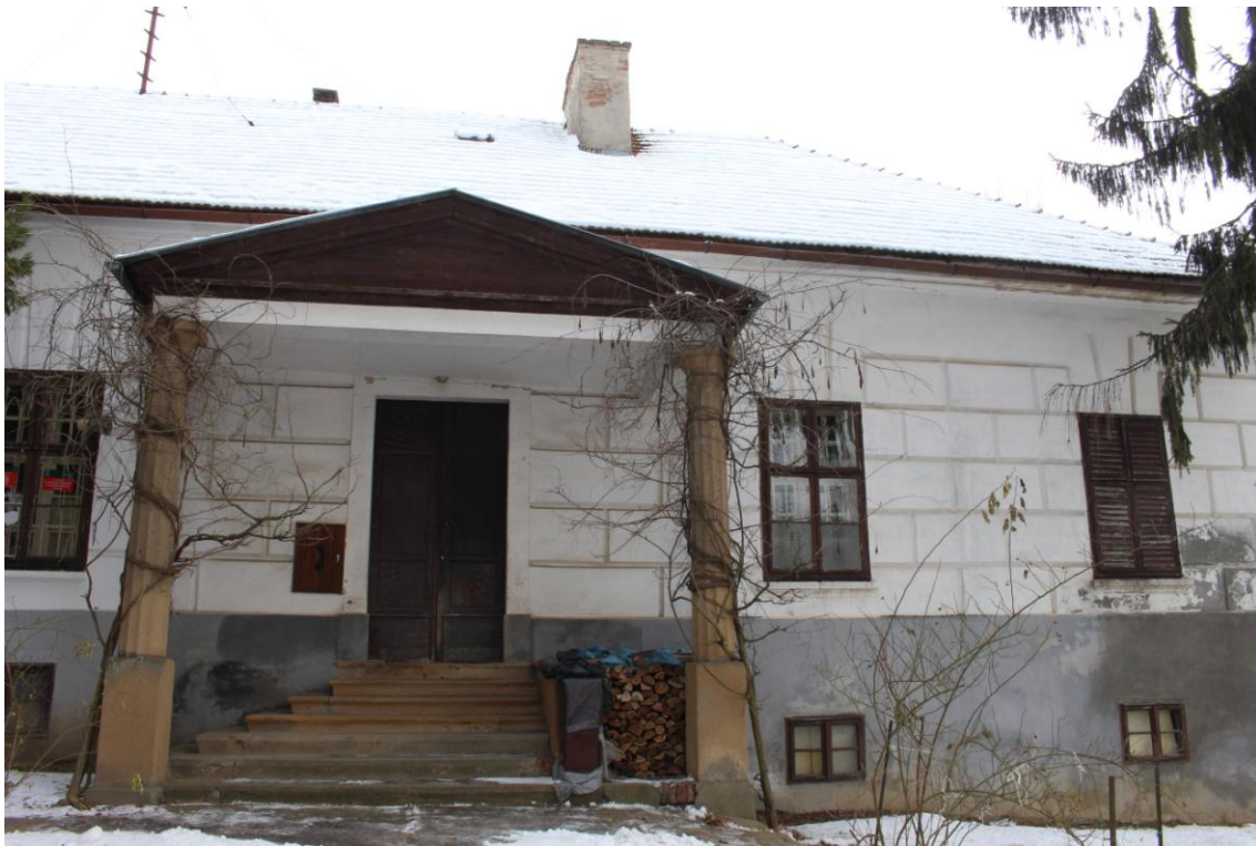
A lengyeli „kiskastély”