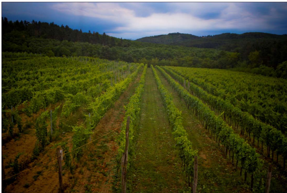
Madarász-dűlő, Dúzs határában