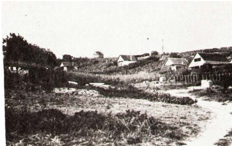
Hógyészi szőlők egy régi fotón